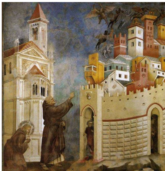
Giotto: Francisco expulsa a los demonios de Arezzo (LM 6,9)