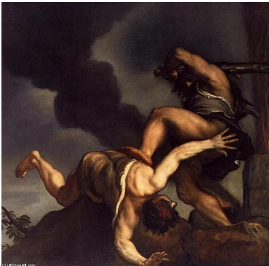
Tiziano, Caïn i Abel